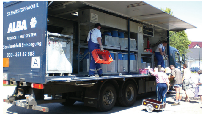
Abgabe von Schadstoffen aus Haushalten über das Schadstoffmobil

Falls Ihnen eine persönliche Abgabe zu den angegebenen Terminen nicht möglich ist, nutzen Sie die ständige unentgeltliche Abgabemöglichkeit auf unseren Wertstoffhöfen in Torgau und Rechau-Zöschau.